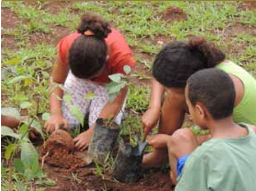
Plantio para recuperação de área degradada do Parque Ecológico do Barroco em Matozinhos