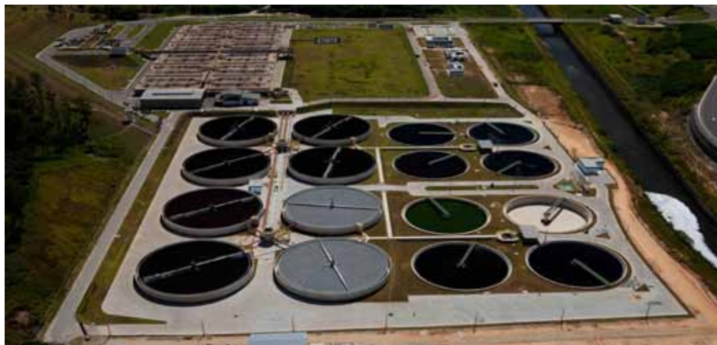
Estação de Tratamento de Esgoto do Ribeirão do Onça - Belo Horizonte.