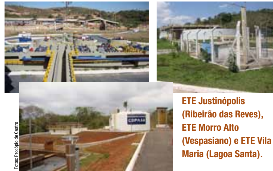
ETE Justinópolis (Ribeirão das Reves), ETE Morro Alto (Vespasiano) e ETE Vila Maria (Lagoa Santa).

Esgoto' para implantar redes coletoras e interceptoras de esgoto, além da construção de Unidades de Tratamento de Resíduos (UTR).