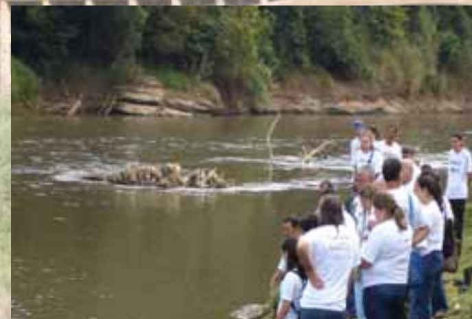
Capacitação à beira do rio das Velhas

Os Amigos do Rio surgiram com o Monitoramento Ambiental Participativo (MAP), um programa que vem sendo desenvolvido na bacia do rio das Velhas desde outubro de 2006.