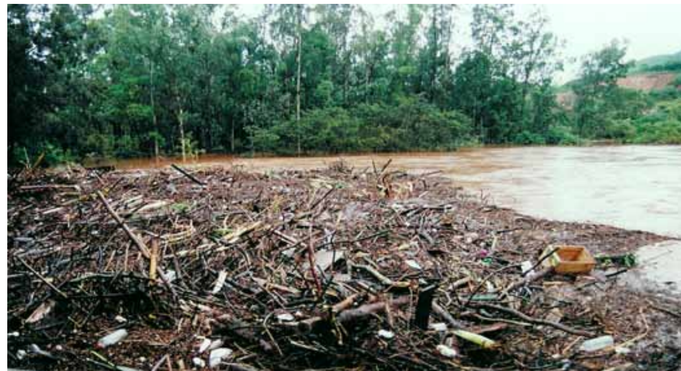
Detritos em enchente do rio das Velhas

O pior desempenho de pontos próximos a grandes adensamentos urbanos fica muito evidente em um recorte que reúne as 34 coletas feitas pela equipe da SOS Mata Atlântica nas 32 subprefeituras da cidade de São Paulo.