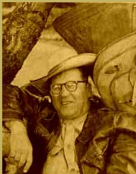
João Guimarães Rosa

Com falta de ar progressiva, ou seja, com a “respiração difícil de um cachorro veadeiro que volta da caça”, Cassiano Gomes teve que parar em um povoado “de gente miúda, amarelada ou amaleitada”: “Mas, no caminho, foi piorando, e teve que fazer alto no Mosquito - povoado perdido num cafundó de entremorro, longe de toda a parte [...] Pois foi lá que Cassiano Gomes teve o seu desarranjo, com a insuficiência mitral em franca descompen-