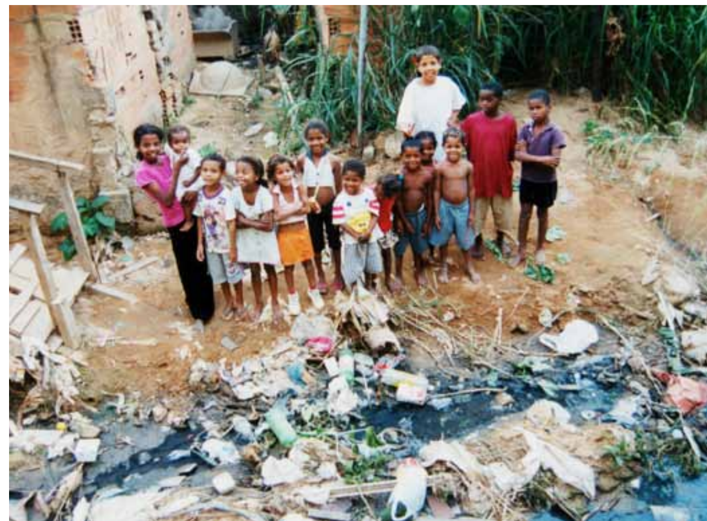
A falta de saneamento básico no Brasil revela a preocupante situação das crianças, que vivem em locais sem condições mínimas de higiene e saúde.