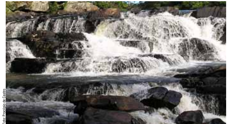
Cachoeira do rio Cipó

mento empresarial e administrativo de recursos hídricos, de massas d'água, de caixas d'água. A boa gestão, ao contrário, pode incorporar toda a sociedade, a educação ambiental, as paixões para soerguer o nosso país, com um novo imaginário de vida, solidariedade e cidadania. O ser humano não sobrevive à destruição da flora e da fauna, pois depende integralmente do meio ambiente para sobreviver, para se alimentar e respirar. Como bem afirma Apolo Heringer a "voz dos peixes" fala através dos bioindicadores dos corpos d'água, que monitoram a integralidade do sistema ambiental terrestre e aéreo. Em sentido metafórico, a água representa o sangue da Terra e eixo sistêmi-