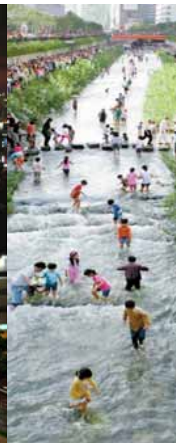
Rio Cheonggyecheon em Seul - Coreia do Sul